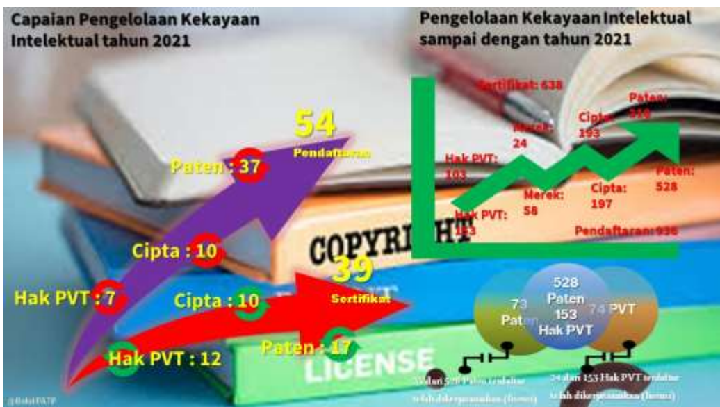
Gambar 1. Infografis pengelolaan kekayaan intelektual berupa paten, merek, cipta, dan Hak PVT.

Pengelolaan Kekayaan intelektual memerankan penting dalam melindungi hasil karya yang telah dihasilkan oleh inventor. Perlindungan HKI menjadi syarat mutlak yang harus dilakukan sebelum invensi itu dikerjasamakan dengan dunia usaha melalui mekanisme lisensi. Data perkembangan pengelolaan HKI pada tahun 2021 dapat digambarkan seperti pada infografis pengelolaan Kekayaan Intelektual tahun 2021, sedangkan lebih rinci invensi yang didaftarkan HKI dapat dilihat pada lampiran laporan ini.