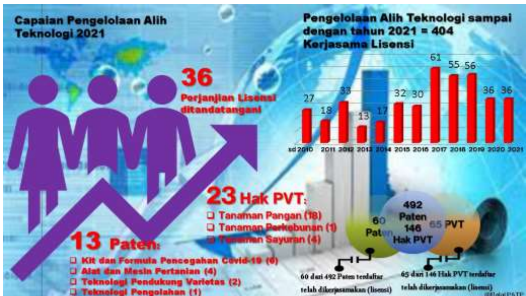
Gambar 2. Infografis pengelolaan alih teknologi berupa kerjasama lisensi atas invensi Balitbangtan

Salah satu kegiatan hilirisasi atas invensi Balitbangtan adalah melalui mekanisme Kerjasama lisensi antara Balitbangtan yang diwakili unit kerja pemilik invensi dengan dunia usaha. Kepeminatan atas invensi Balitbangtan dari tahun ketahun menunjukkan peningkatan, pada tahun 2021 tercatat 36 perjanjian ditandatangani antara Balitbangtan dengan dunia usaha, informasi lengkap seperti yang tergambar pada infografis pengelolaan alih teknologi 2021. Sedangkan data lengkap Kerjasama lisensi yang ditandatangani terlampir dalam laporan ini.